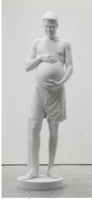
Resim 7: Marc Quinn, Thomas Beatie, 2009

Beden, üzerinde araştırma yapılabilecek bir alan olarak her zaman izlenmeye ve yeniden tasarlanmaya açık bir yapıdır. Sahip olduğumuz beden süreç içinde yeniden tanışabileceğimiz sürekli dönüşüm geçiren bir organizma olup, zihinsel ve ruhsal süreçlerle karmaşık biçimde birbirine bağlıdır. Bedende her zaman beklenmedik değişimlerle karşılaşmak mümkündür. Ya da insan bu değişimi kendisi gerçekleştirmek isteyebilir. Bu doğal değişimi ve farklılığı inanılmaz bulan ve dışlayan zihinleri tek yönlü bakış açısından kurtarmak zor bir mücadeledir. Bu mücadeleyi aradaki perdeleri kaldırarak gerçekleştirmek isteyen bir başka sanatçı JEB kısaltmasını kullanan Joan Elizabeth Biren'dir. Sanatçının: "Değiştirmek istediğimi imajlar aracılığıyla yapabilirim. Niyetim insanları birbirlerine görünür kılmak. Gizlendiğinizde politik bir değişim gerçekleştiremezsiniz. .. Bir kadın, bir lezbiyen ve bir feminist olarak, bu üç özelliğimi zihnimden atabilirim fakat varoluşumu asla." (Silberman, 2011:10-13) şeklinde ifade ettiği düşüncelerini fotoğraflarında da izlemek mümkündür. Sanatçı 2011 tarihli Jan ve Barbara'yı Lezbiyen Sağlık ve Danışmanlık Kolektifinde Bir Rahim Araştırması Yaparken isimli fotoğrafıyla (Resim 8), konuyu doğal bir sağlık araştırması sahnesi olarak görüntüler.