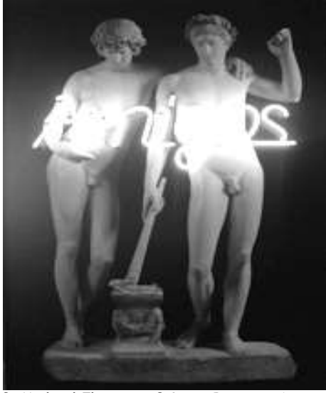
Resim 3: Michael Elmgreen & Ingar Dragset, Amigos, 2011

Böyle bir atmosfer içinde dahi izleyici şöyle düşünebilir: İkili cinsel kimliğe, iktidarın kurguladığı toplumsal sisteme uyum sağlamak neden mümkün olmasın? İktidara boyun eğmemenin, sistemin dışında hareket etmenin bir tür delilik olduğu inancına karşı, doğru inşa edilmemiş toplumsal sistemin dışına itilmemek için, bu sisteme aitmiş gibi taklit görünüm sergilerken kendi içinde alt bir kimlik oluşturmanın daha büyük bir delilik olduğudur. Sanatçı Taner Ceylan, taklit görünüm ile alt kimliğe ait görünümü aynı anda göstermeyi başarmıştır. Ceylan, İstanbul Modern Sanat Müzesi'nde Geçmiş ve Gelecek sergisindeki 2006 tarihli Beyaz Fonda Alp isimli çalışması (Resim 4) hakkında İstanbul Modern Sanat Müzesi'nde bir röportaj vermiş, bedendeki cinsiyetler arası iki ruh halini anlatmak istediğini belirtmiştir: