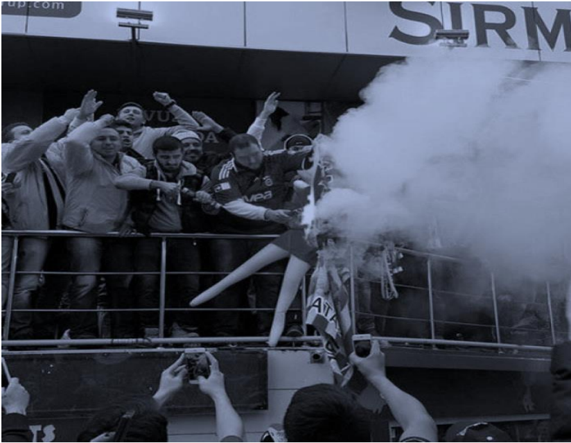
Foto 1. Haber Başlığı: “Fenerbahçe-Galatasaray maçı öncesinde, erkek taraftarlar, Galatasaray takımını küçük düşürmek ve aşağılamak için bir kadın mankene Galatasaray forması giydirip yaktı” (Şiyasi Haber, 2016).

hegemonyayla var etmeye çalışan erkeğin “özgürlük alanı” içinde kaybolup gitmektedir. Erkeğin silah kullanımını meşru kılan unsurlardan biri de kentin çeşitli yerlerine serpiştirilmiş halde bulunan eli silahlı erkek ve asker heykeli temsilleridir. Böylece çocukluk çağından itibaren gerçek erkeklik edimiyle donanan bir birey, hem üzerine yüklenen cinsiyetçi roller, hem de mekânda çeşitli eril ve hegemonik ideolojilerin (savaşçı erkek figürünün) bir araya gelişiyle, erkekliğini özel mekânda olduğu gibi kamusal mekânda da her tür ego gösterimiyle icra etmek adına özgürleşmektedir. Özellikle de futbol maçı galibiyetlerinde temsili kadın (manken) yakmalar (Foto 1), erkeğin aktifliğinin ve kadına yönelik uyguladığı şiddetin toplumsal hayatta meşruiyet elde etmiş olmasından kaynaklanmaktadır. Bunu yapmaktan özel mekânda (evde / içeride) bir çekincesi olmayan eril bilinç, kamusal mekânın ortasında, şiddeti üretirken şiddetin fotoğrafını -muhtemelen keyif duyumsarak- çeken bir kitleyi de arkasına almaktadır (bkz. Foto 1).