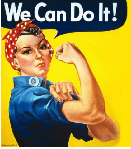
Şekil 2. İkinci Dünya Savaşı Esnasında İşçi Kadınları Temsil Eden İmaj: Kadının Çifte Görevi: Ev İşleri ile Ücretli İşin Birlikteliği.

Böylelikle ‘kapitalizmi ve kadının astlığını üreten bir erkek egemen sistem’ olarak patriyarka, günümüz toplumlarındaki kadınlar için dört temel görev / iş alanını var ediyor: (1) cinsiyet rollerine dayalı ve özellikle de aileyi koruyucu olarak annelikle ve eş olmayla ilgili toplumsal ödevlerin yerine getirilmesi; (2) ücretli veya ücretsiz işgücü olacak nesillerin üretimi; (3) cinsiyet rollerine özgü ekonominin sürdürülebilirliğine katkı; (4) erkeklere karşılık daha düşük ücretlerle işgücü piyasasına katılımın sürdürülmesi (McDowell, 2007: 81- 82).