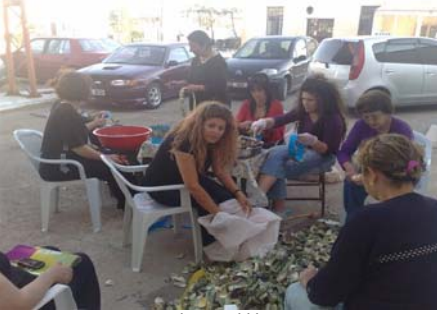
Fot. 4. Enginar Festivali Hazırlıkları