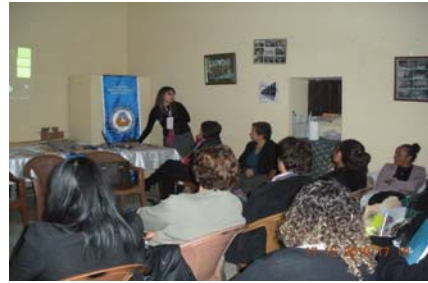
Fot. 3. Kadına Yönelik Şiddete Karşı Hak Arama Semineri