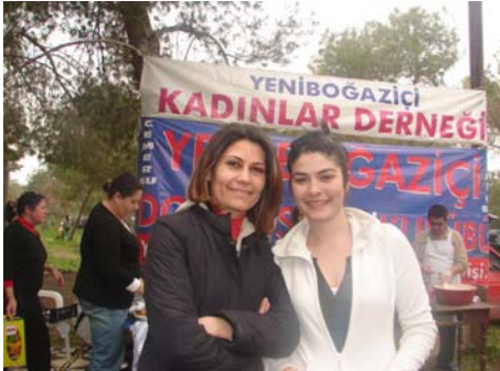
Fot. 1. 8 Mart Kadınlar Günü Etkinliği