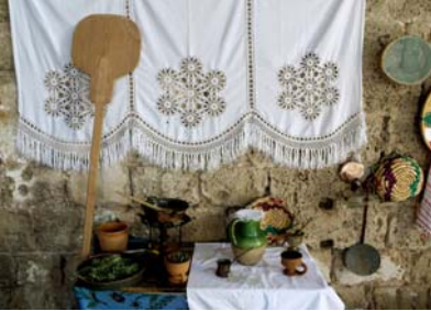
Fot. 2. Sandıktaki Hazine: Kadın El Sanatları Sergisi