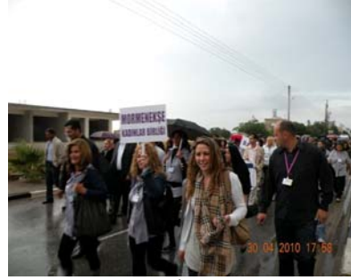
Fot. 5. Enginar Festivali Kortej Yürüyüşü

Birliğin ileriye dönük amaçları arasında ise Mormenekşe'de ve çevre köylerde yaşayan kadınların faydalanabileceği bir spor salonu açmaktır.