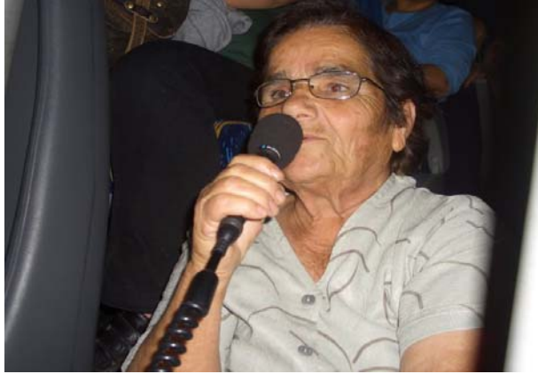
Fot. 3. Kadın Dayanışma Konseyi Toplantısı