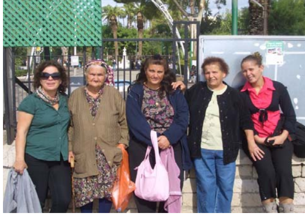
Fot.4. Boğaziçili kadınlar yardım çalışmaları sırasında

Yeni Boğaziçi Kadınlar Derneği ayrıca kadının, köyün toplumsal yaşamına katkısını görünür kılmak amacıyla köy futbol takımına sponsorluk yapmakta ve köylüler arası dayanışmayı artırmak amacıyla düşük gelirli kişi ve ailelere yardım kampanyaları düzenlemektedir (Bkz. Fot.4.).