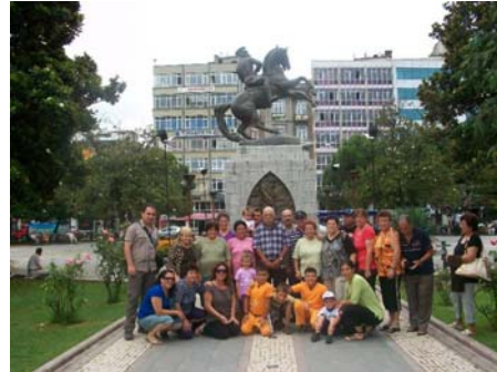
Fot. 2. Yurt dışı gezisi